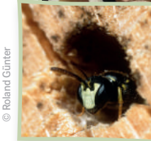
Maskenbiene am Nesteingang

Tipp: Auch wenn es gut gemeint ist: Tannenzapfen, Stroh und rote Lochziegel aus Ton bringen in einer Nisthilfe kaum mehr, als hübsch auszusehen.