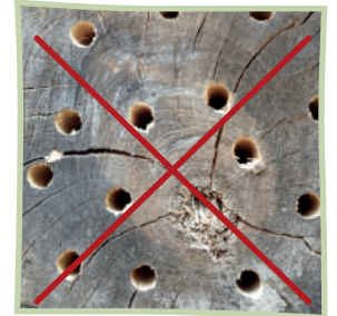
Bohren Sie nicht ins Stirnholz!

Achten Sie insbesondere darauf, scharfe Werkzeuge zu nutzen, sorgfältig zu bohren und die Späne aus den Löchern zu entfernen. Benutzen Sie Holzbohrer verschiedener Durchmesser (2 bis 9 Millimeter) und schaffen Sie etwa 10 Zentimeter tiefe Löcher, gerne auch tiefer.