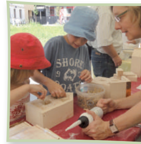
Nisthilfe-Bausätze sind gut geeignet

Wenn Sie gerne Wildbienen beobachten, sind Nisthilfen eine geeignete Möglichkeit, dies zu tun. Sie können diese mit geringem Zeit- und Kostenaufwand selber bauen. Oberirdisch nistende Wildbienen brauchen dafür vor allem vier Dinge: Bruträume mit geeignetem Durchmesser, einen Regen-