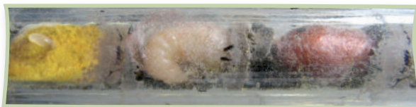
Pollenbrot mit Ei – Larve – Puppe

Nach 3 bis 6 Tagen schlüpft bei den meisten Arten aus dem Ei die Larve. Diese ernährt sich vom Pollenbrot, welches ihr das Muttertier zuvor in die Nistkammer legte. Die Larve entwickelt sich wohlgenährt über mehrere Stadien und überwintert meist als Puppe oder Imago. Im darauffolgenden Frühling gräbt sie sich durch die Nestverschlüsse. Erst fliegen die Männchen aus, die nicht selten auf die später folgenden Weibchen warten, um sich sogleich zu paaren.