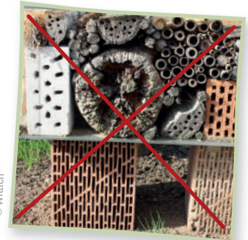
So bitte nicht