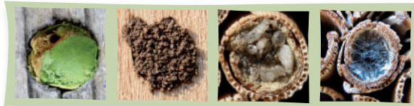
Blattschneiderbiene Mauerbiene Scherenbiene Maskenbiene